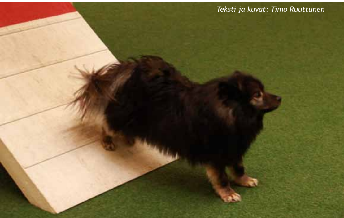
Teksti ja kuvat: Timo Ruuttunen

Kakkosluokassakaan emme kovin montaa kisaa ottaneet, sillä 10 startin jälkeen oli kakkosen nollat kasassa ja kolmosluokan aloitimme 25.1.2009. Vuosi 2009 meni pitkälti opetellessa ja tuntumaa hakien; toki jokunen nolla saatiin, sillä olimmehan me heti toisena vuoden agilitykoirakisassa Tarmon perässä tuloksella 0,88 !