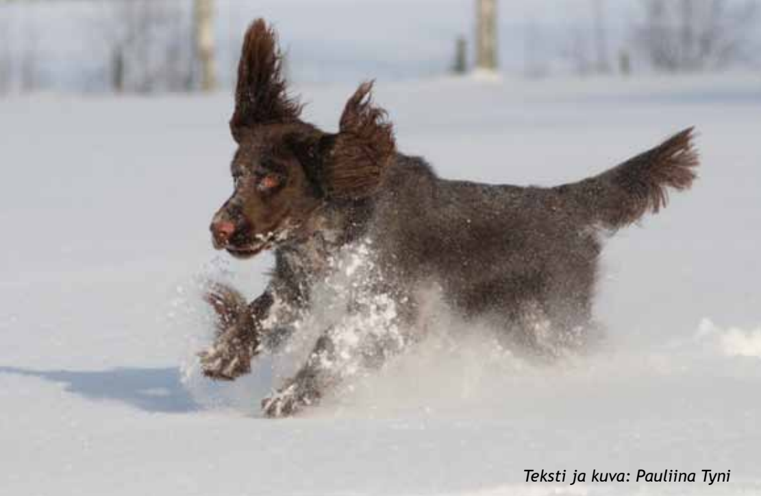
Teksti ja kuva: Pauliina Tyni