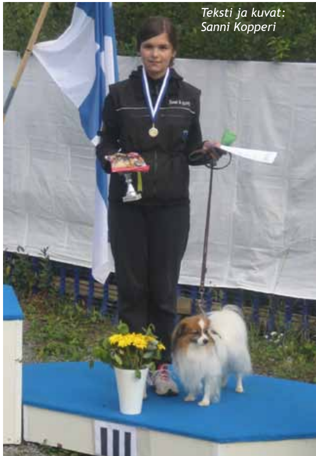
Teksti ja kuvat: Sanni Kopperi

Kilpailuissa menestyminen ei ole kuintenkaan pää-asia, vaan se että saa tehdä koiran kanssa yhdessä ja näkee sen kuinka koira tykkää. Välillä tuntuukin että Harry nauttii enemmän siitä, että saa harrastaa ja treenata rauhassa. Kun taas kisoissa on ympärillä Harryn luonteelle ehkä liian paljon ihmisiä ja muita koiria. Ne saavat pienen koiran pään pyörälle. Mutta se pitää muistaa että tätä teh-