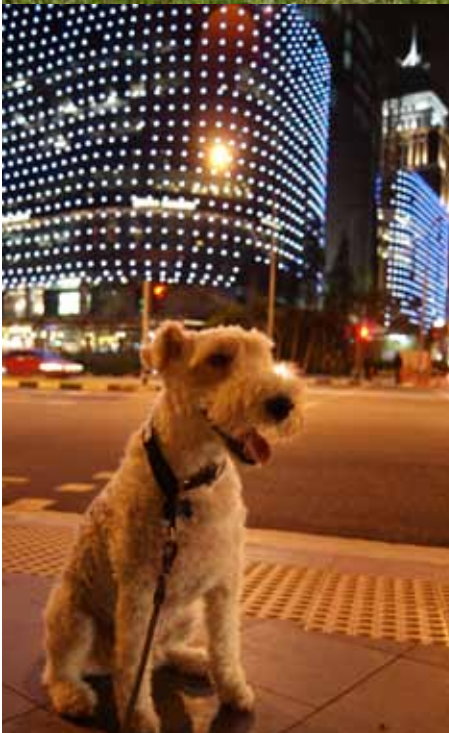
Bling, bling! Orchard Roadilla kauppakeskuksia laskemassa.