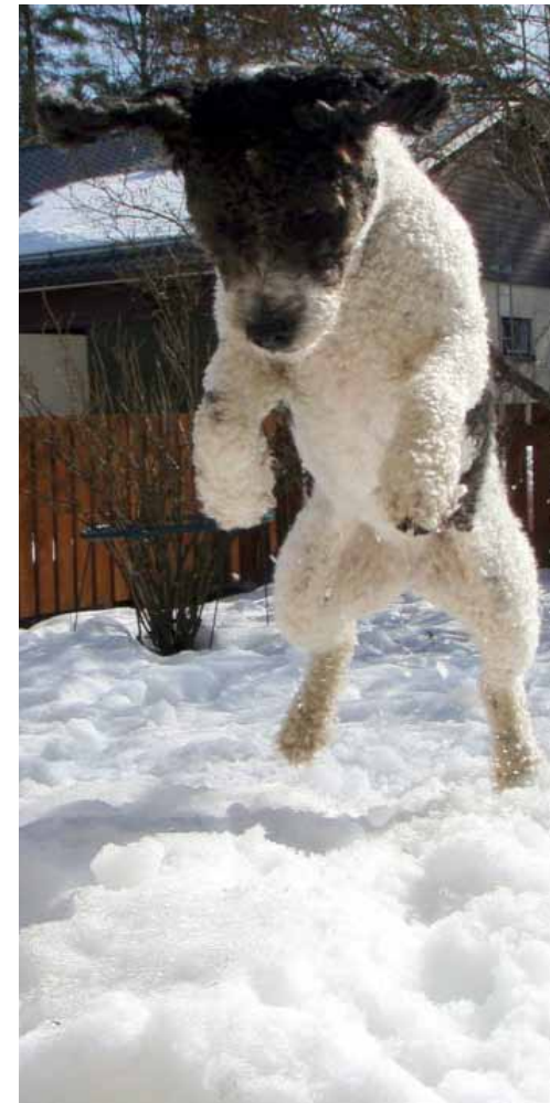
Resepti ja kuva: Sanna Pasma

Ne on sieltä helppo ottaa aina ennen treenejä taskuun, niin kerkeää juuri sulaa sen verran että saa lohkottua pieniä paloja, eikä tarvitse aina huolehtia että jääkaapissa on nakkeja. Helppoa ja tosiaan meillä tehdään mitä vaan näiden herkkujen eteen!!