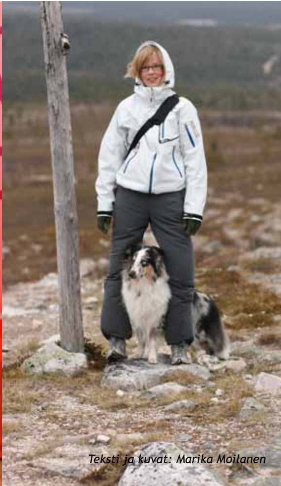
Teksti ja kuvat: Marika Moilanen