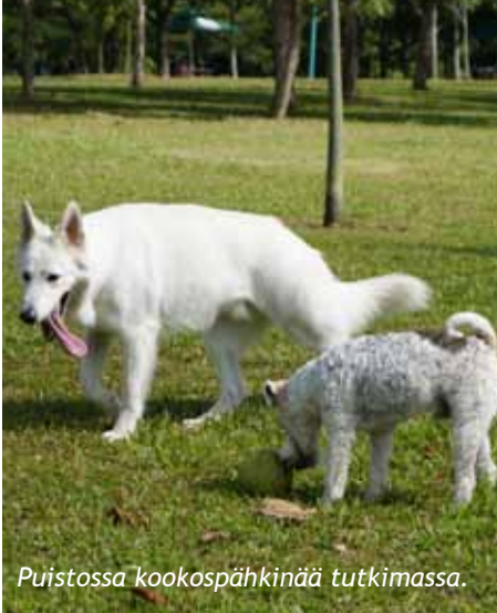
Puistossa kookospähkinää tutkimassa.

Kolumnin kirjoittaja on väliaikaisesti Singaporessa elävä HSKK:n agilityvahvistus, jonka mielipiteet eivät kuvasta HSKK:n yleisiä mielipiteitä. Aiemmat matkakertomukset voit lukea alkaen Kirsun 2009 kesänumerosta (2/2009).