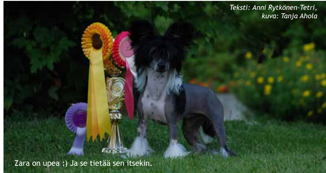
Zara on upea :) Ja se tietää sen itsekin.

Teksti: Anni Rytkönen-Tetri