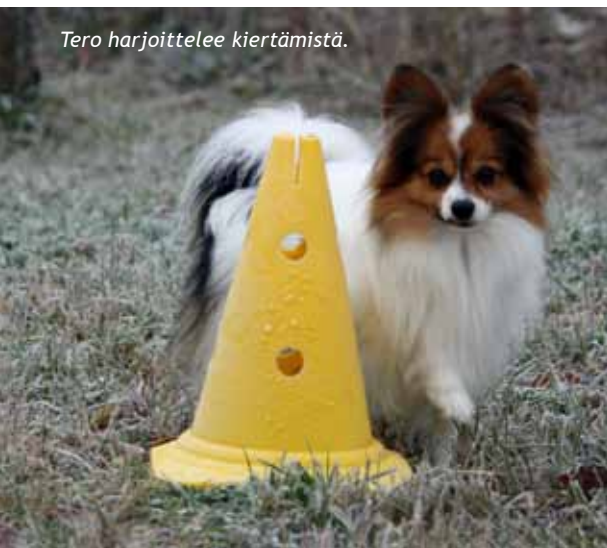
Tero harjoittelee kiertämistä.