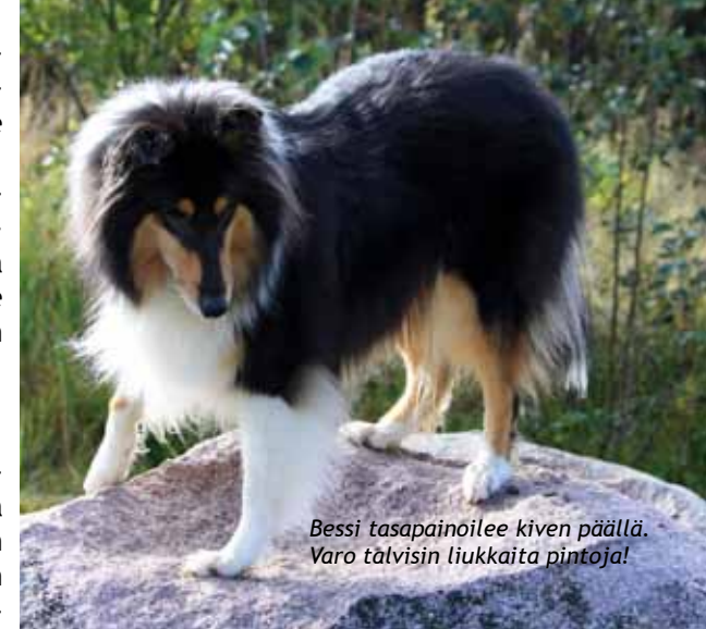
Bessi tasapainoilee kiven päällä. Varo talvisin liukkaista pintoja!

Päivittäin on hyvä seurata koiran liikkumista ja katsoa kuinka koira seisoo, istuu ja makaa. Lisäksi venyttelyt ja hieronta auttavat sinua havainnoimaan koirassa tapahtuvat muutokset. Näin voit paremmin puuttua mahdollisiin oireisiin, joiden johdosta olisi syytä muuttaa harjoitteluja tai tarvittaessa käydä ammattilaisen vastaanotolla. Alkuun koiran seuraaminen voi tuntua työläältä, mutta pian silmä harjaantuu näkemään mahdollisia muutoksia totuttuun, sen kummemmin edes asiaan keskittymättä.